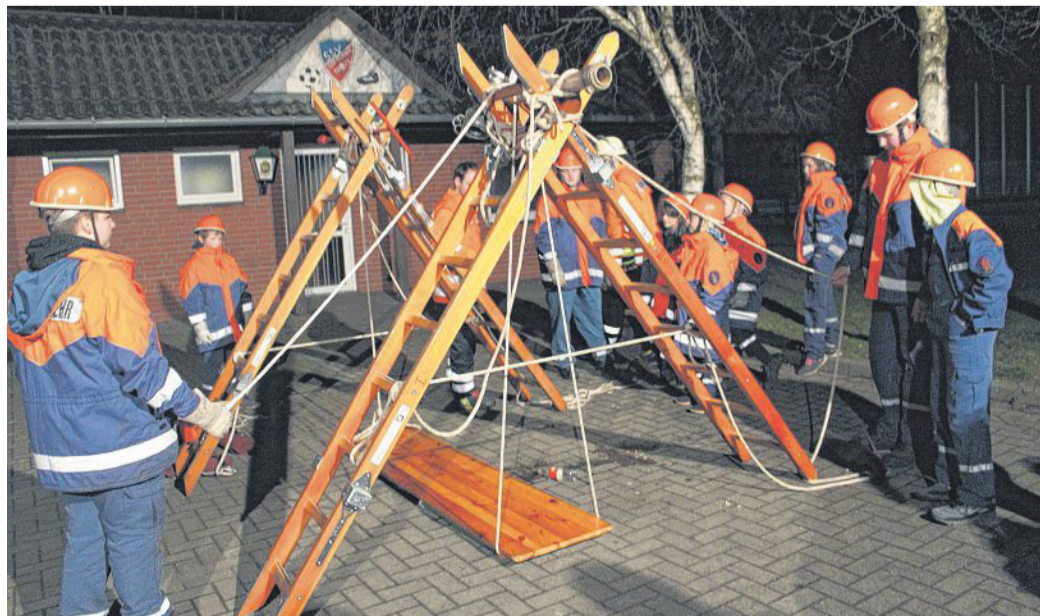
Jugendliche bei den Geschicklichkeitsaufgaben.

ten in Elsfléth angelegt, der besichtigt werden kann. Auf 6000 Quadratmetern ist das ganze Jahr über eine Blumen- und Gräserpracht zu sehen. „Von den vielen eindrucksvollen Bildern dieser Blüten- und Farbenpracht waren die Landfrauen und Gäste sehr angetan“, heißt es von den Uchter Landfrauen abschließend.